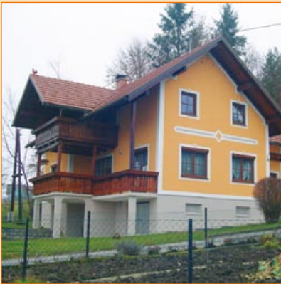
Silikat- oder Kunstharz- Edelputz