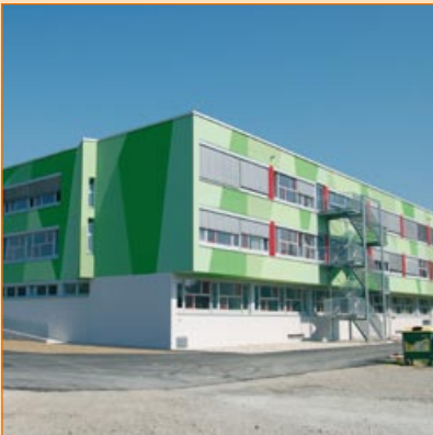
Leichtgrundputz 2 cm